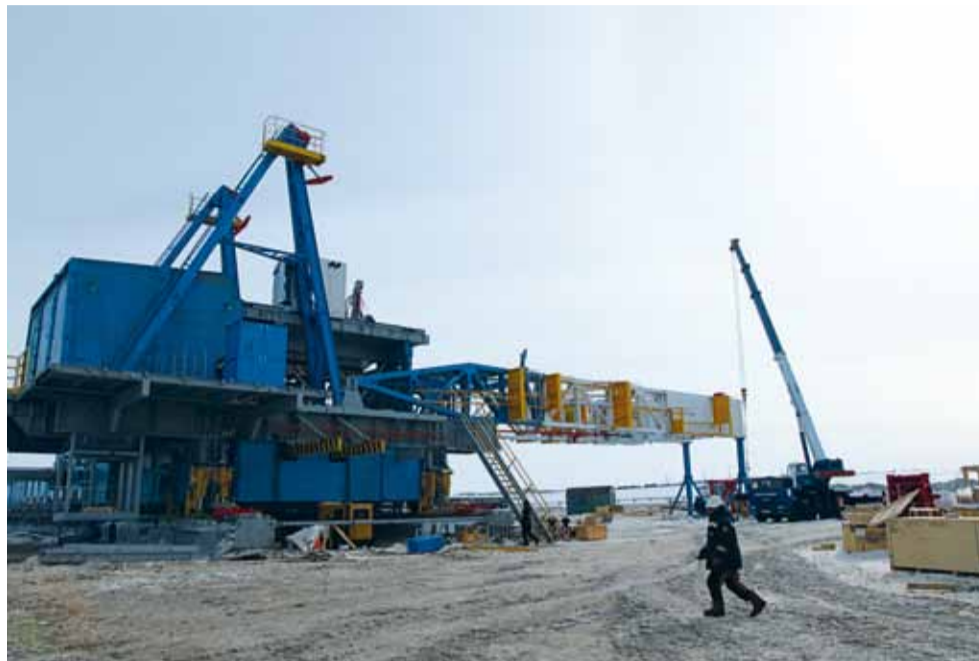
Окончание. Начало на стр. 1

Планируется, что во втором полугодии начнется добыча нефти из расконсервированных скважин на месторождении им. Третьякова на уровне 300 тысяч тонн. Кроме того, будут подключены к добыче новые разведочные скважины, пробуренные в прошлом и нынешнем году в соответствии с лицензионным соглашением. Появятся также три кустовые площадки на месторождении Третьякова, с которых в 2013–2014 годах будет пробурено 17 новых скважин. Всего же общий ожидаемый эксплуатационный фонд по двум месторождениям должен превысить 200 скважин. ■