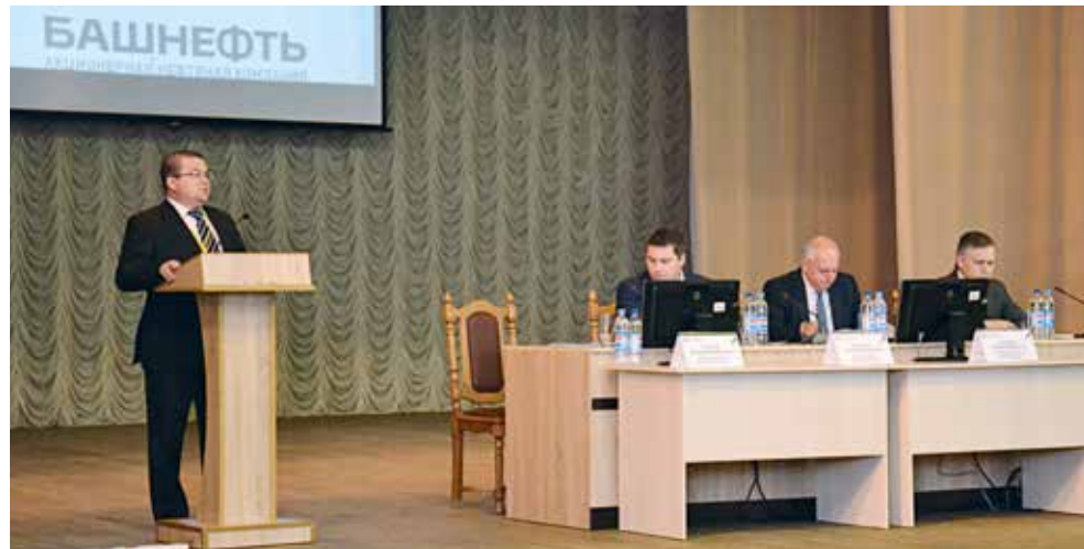
В «БАШНЕФТЬ-ДОБЫЧА» ПРОШЛА ОЧЕРЕДНАЯ ВСТРЕЧА КОЛЛЕКТИВА И ТОП-МЕНЕДЖМЕНТА «БАШНЕФТИ».

Опробованный в прошлом году формат общения руководителей блока разведки и добычи с мастерами и начальниками цехов всех НГДУ «Башнефть-Добыча» позволяет определить круг задач, с которыми линейные руководители сталкиваются практически ежедневно, и выработать эффективный поиск решений. На этот раз в Доме культуры г. Дюртюли собрались более 200 мастеров, от работы которых зависят выполнение производственных показателей и во многом безопасность труда.