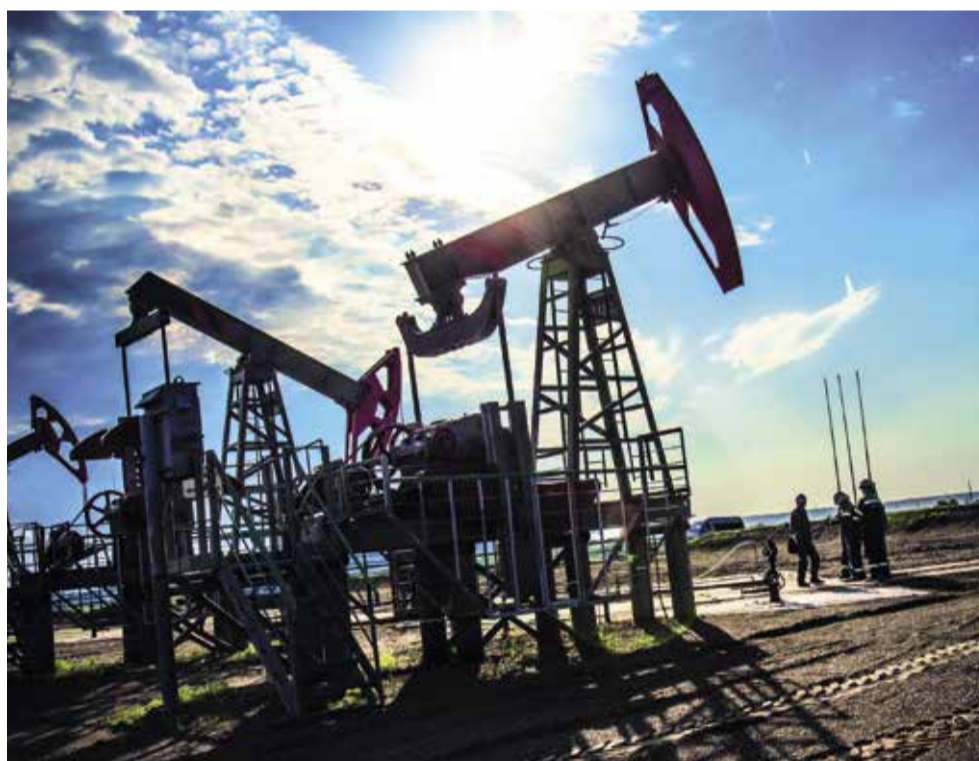
Окончание. Начало на стр. 1

А также финансированием приобретенного в марте 2014 года ООО «Бурнефтегаз», ведущего разведку и добычу нефти в Тюменской области.