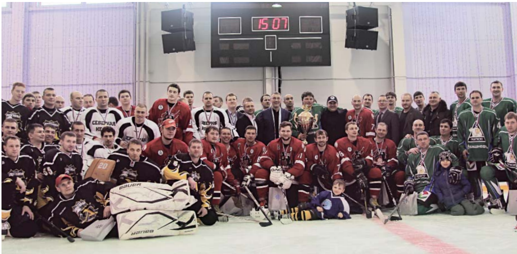
КОМАНДА «БАШНЕФТЬ-ПОЛЮСА» СТАЛА ПЕРВЫМ ОБЛАДАТЕЛЕМ КУБКА ГУБЕРНАТОРА НЕНЕЦКОГО АВТОНОМНОГО ОКРУГА.

Т акого хоккея нарьян-марский спортивный комплекс «Труд» еще не видел. В течение трех дней на ледовой площадке за Кубок губернатора сражались команды компаний-недропользователей, работающих на территории округа, а также сборная региона, не без иронии назвавшая себя «Пингвины НАО».