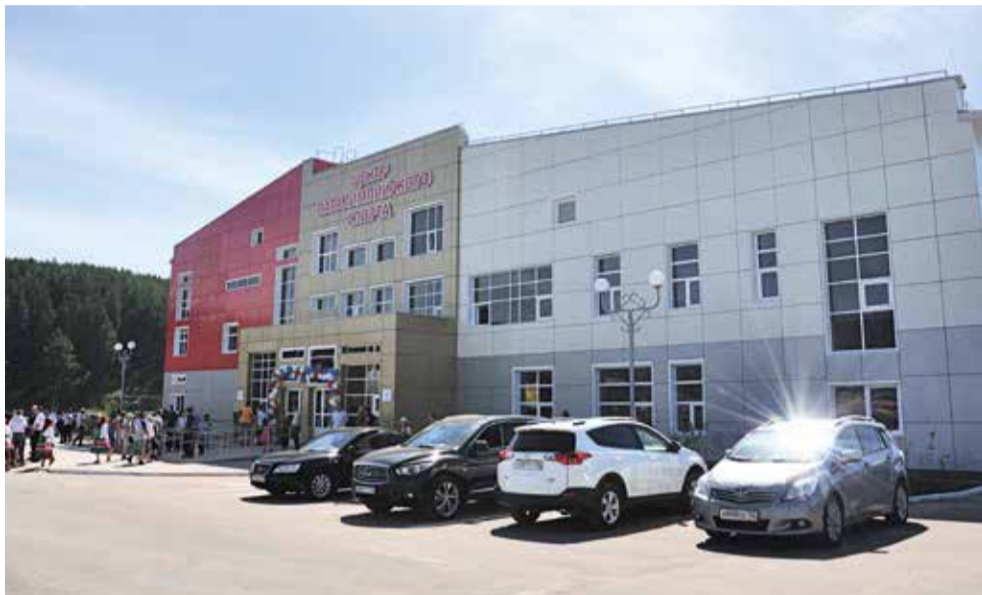
В МИШКИНСКОМ РАЙОНЕ БАШКИРИИ ОТКРЫЛИ ПЕРВЫЙ В РЕСПУБЛИКЕ ПАРАЛИМПИЙСКИЙ ЦЕНТР СПОРТА. СРЕДСТВА НА ЕГО СТРОИТЕЛЬСТВО ВЫДЕЛИЛА НАША КОМПАНИЯ.

Фундамент здания заложили еще в 2011 году, однако по различным причинам строительство затянулось. Для завершения объекта понадобились дополнительные средства, и вот наконец двери спортивного дома паралимпийцев открылись.