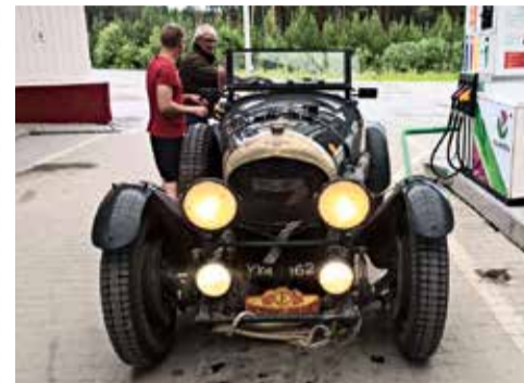
АВТОМОБИЛИ РЕДКИХ МАРК МОЖНО БЫЛО УВИДЕТЬ НА АЗС «БАШНЕФТИ» В ЕКАТЕРИНБУРГЕ.

90 экипажей из 24 стран мира, путешествующих в рамках ретро-ралли «Пекин – Париж», останавливались в Екатеринбурге на ночевку. Пилоты машин головной группы для пополнения бензобаков выбрали АЗС «Башнефти».