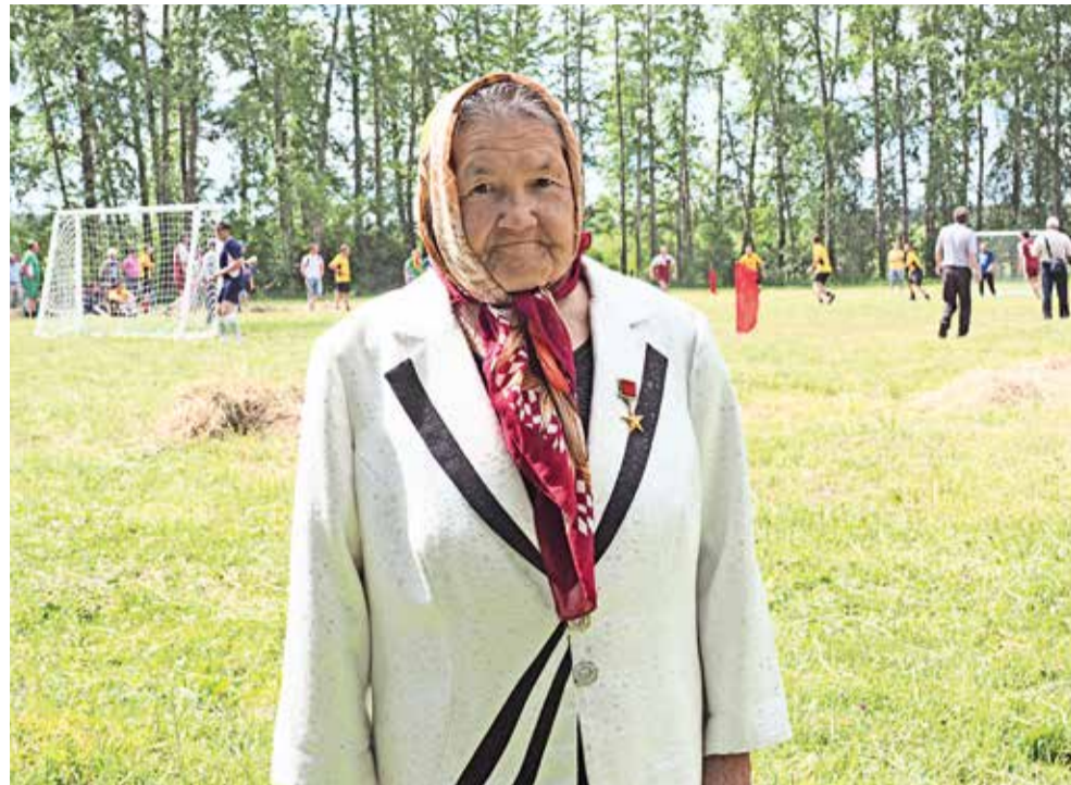
10-Й ЮБИЛЕЙНЫЙ ТУРНИР ПО МИНИ-ФУТБОЛУ ИМЕНИ АНФИЗЫ ГИНИАТУЛЛИНОЙ СРЕДИ КОМАНД НГДУ «АРЛАННЕФТЬ» ПРОШЕЛ НА СТАДИОНЕ ЯМАДИНСКОЙ СРЕДНЕЙ ШКОЛЫ В ЯНАУЛЬСКОМ РАЙОНЕ БАШКИРИИ.