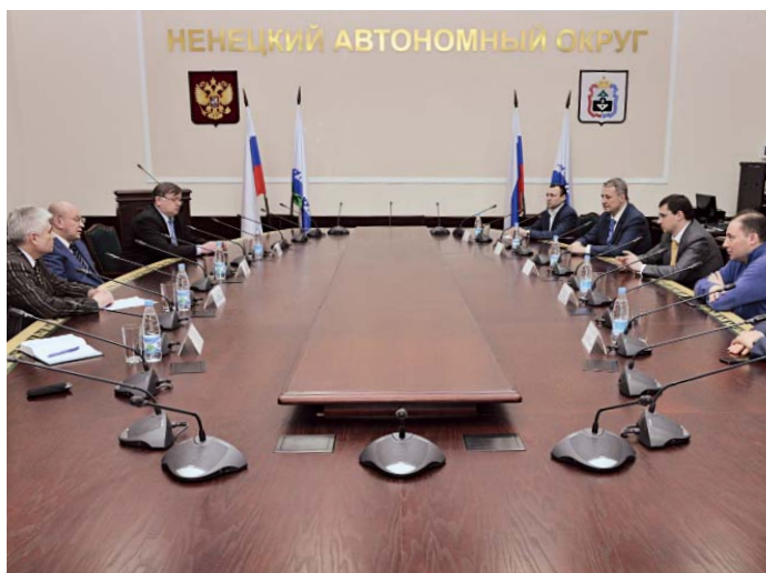
28 ФЕВРАЛЯ ДЕЛЕГАЦИЯ В СОСТАВЕ РУКОВОДИТЕЛЕЙ АФК «СИСТЕМА» И «БАШНЕФТИ» СОВЕРШИЛА РАБОЧУЮ ПОЕЗДКУ В НЕНЕЦКИЙ АВТОНОМНЫЙ ОКРУГ.