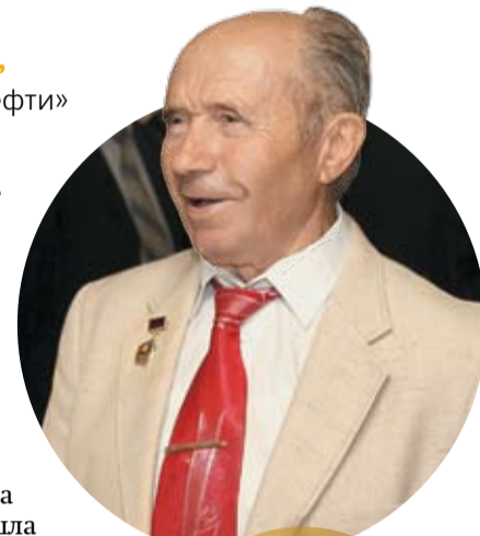
Богуслав Сандурский, генеральный директор «Башнефти» (1985–1993 гг.):

– После окончания Нефтяного института в 1960 году я начал работать в НГДУ «Башнефть» оператором по добыче в поселке Дюртюли. Тогда это еще был не город: жили в бараках, на месторождение ездили на лошадях и тракторах. Но уже тогда отмечали День нефтяника как главный профессиональный праздник всех работников нефтедобычи. К этому дню всегда были приурочены разнообразные соревнования. В советское время это были соревнования различных подразделений предприятия: нефтегазодобывающих направлений, управлений буровых работ, строительных подразделений и других. Также к этому празднику всегда старались приурочить открытие производственных и социальных объектов предприятия. Работникам торжественно вручались различные премии, ордера на квартиры, путевки в санатории. Я до сих пор отмечаю День работников нефтяной и газовой промышленности. Болею всей душой за развитие компании, ведь на сегодня это крупнейшее объединение предприятий добычи, переработки и реализации нефтяной продукции. Желаю компании успехов и достижений в своей деятельности!