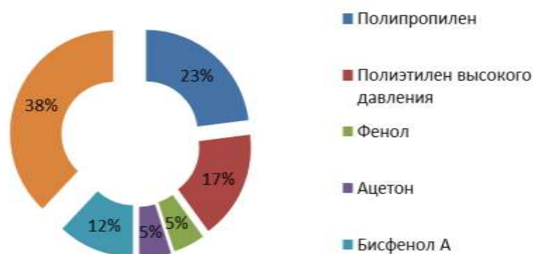
Диаграмма 1. Структура продаж продукции ОАО «Уфаоргсинтез», 1 кв. 2014 года, %

Основным рынком сбыта продукции ОАО «Уфаоргсинтез» является рынок Российской Федерации. Так, в 1 квартале 2014 года доля выручки от реализации продукции на внутреннем рынке составила 62%. Среди ключевых экспортных направлений можно отметить Китай и страны Восточной Европы (диаграмма 2).